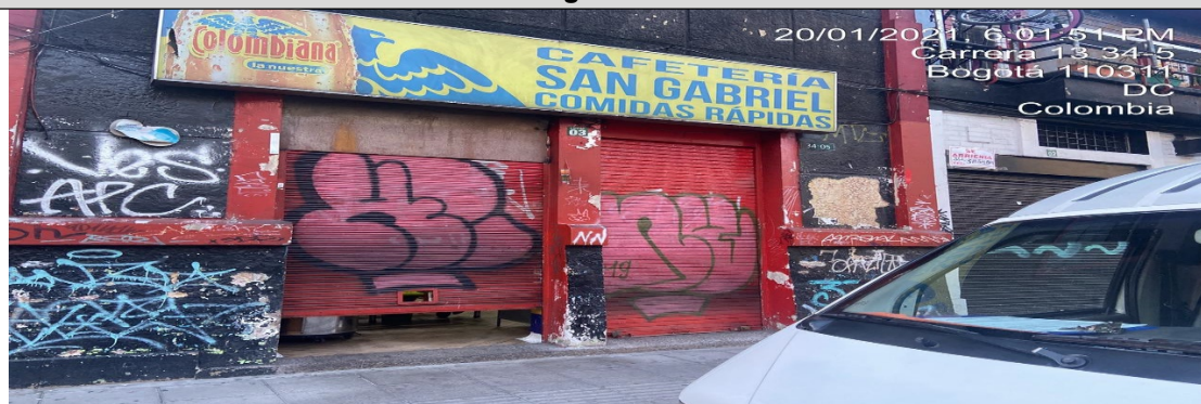
Fachada del establecimiento